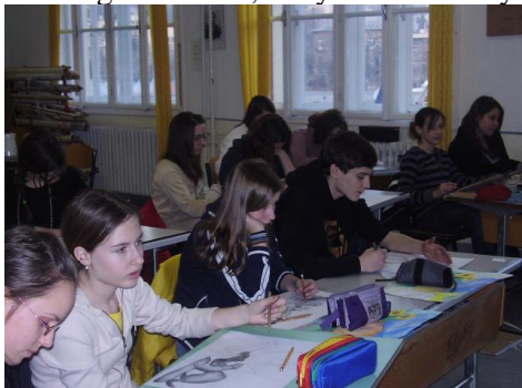
Képek a versenyről

Köszönjük a Kodály Zoltán Ének-zenei Általános Iskola, Gimnázium és Zeneiskolának a verseny színvonalas megrendezését, melynek eredménye egy kellemes, jó hangulatban eltöltött délután volt.