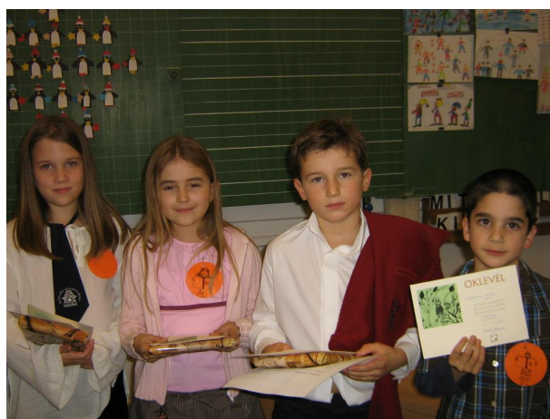
A harmadik évfolyam győztesei

Köszönet az Áldás Utcai Általános Iskolának a verseny színvonalas megrendezéséért.